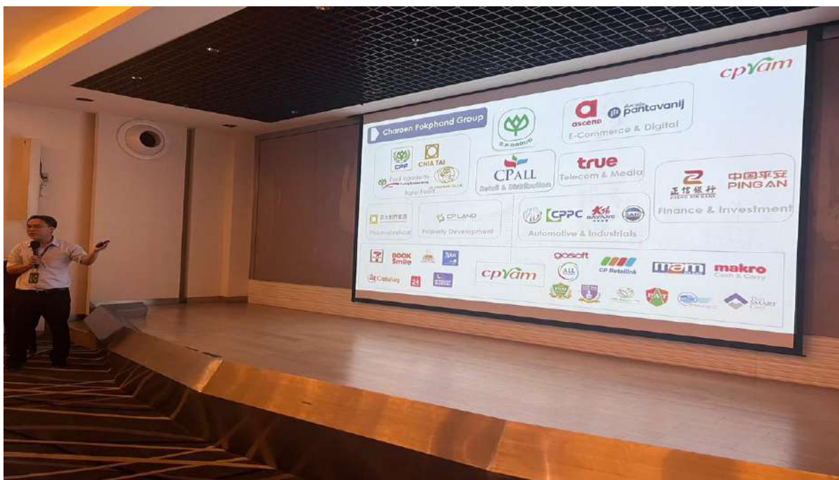
ภาพ 7 โรงงานอื่นในเครือของบริษัท ซีพีแรม จำกัด