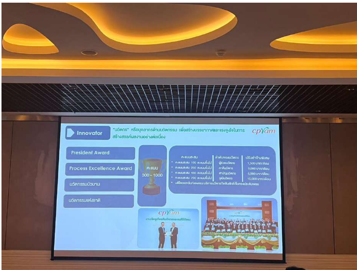
ภาพ 6 งานศูนย์นวัตกรรม บริษัท ซีพีแรม จำกัด