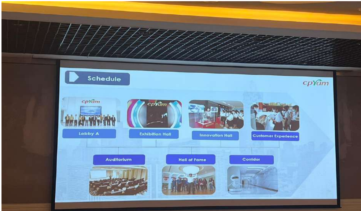
ภาพ 4 การแนะนำแผนกต่างๆ ของบริษัท ซีพีแรม จำกัด