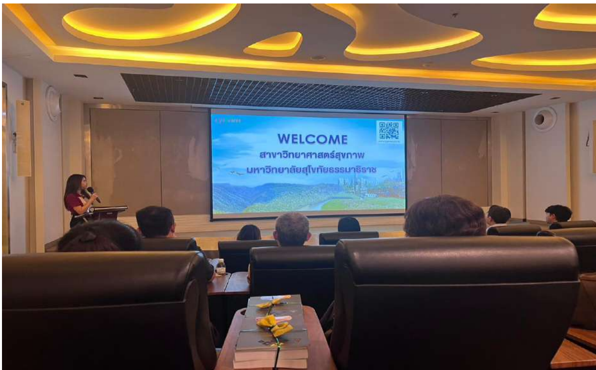
ภาพ 3 ทางบริษัท ซีพีแรม จำกัด กล่าวต้อนรับ และแนะนำบริษัท ซีพีแรม จำกัด