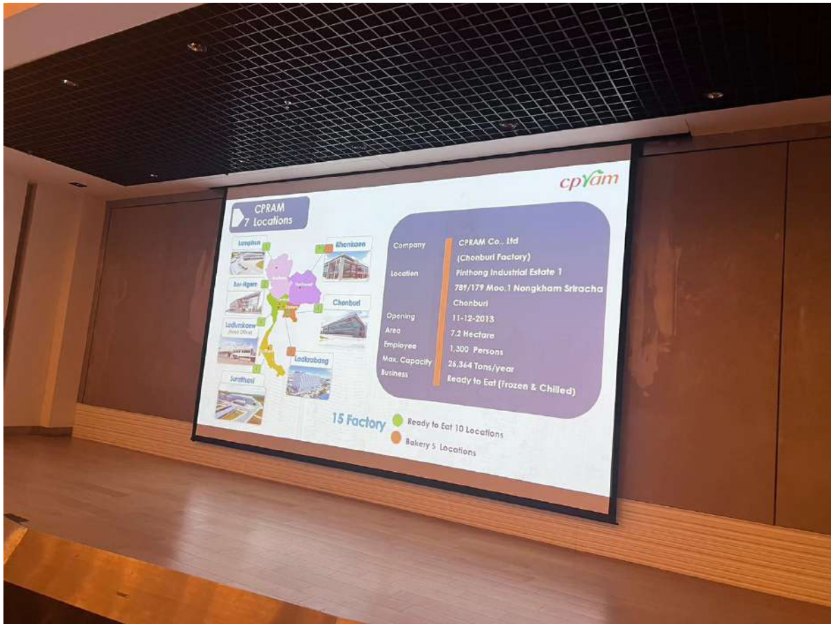
ภาพ 8 เขตรับผลิตของของบริษัท ซีพีแรม จำกัด