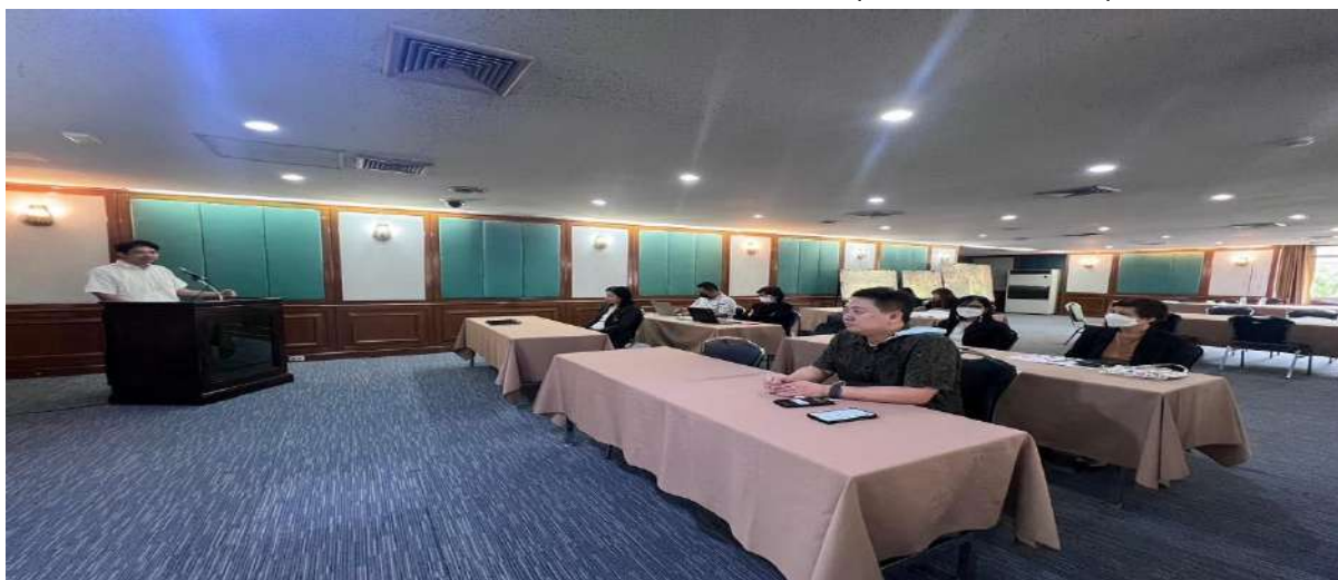
ภาพที่ 2 เจ้าหน้าที่หน่วยเลขานุการกิจและคณาจารย์เข้าร่วมประชุมเชิงปฏิบัติการฯ