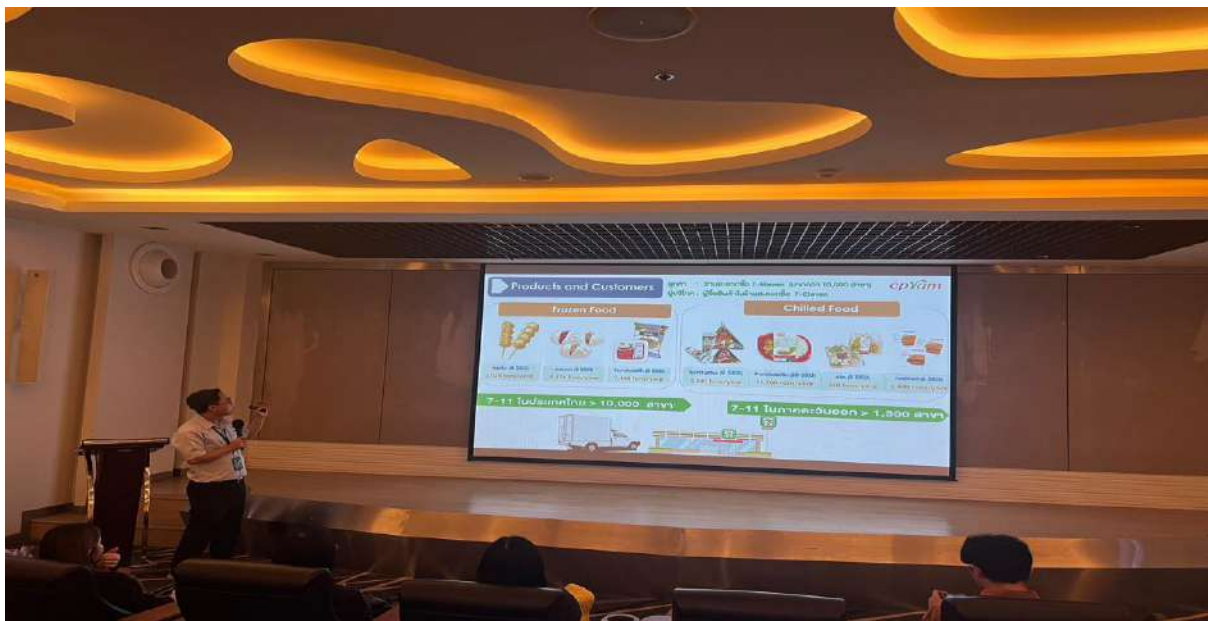
ภาพ 5 สินค้าที่ผลิตของบริษัท ซีพีแรม จำกัด