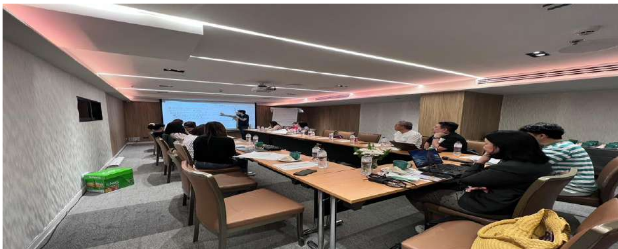
ภาพ 13-14 คณาจารย์และเจ้าหน้าที่หน่วยแลชานุกาการกิจนำเสนอแผนเพื่อปรับปรุงแผนยุทธศาสตร์และแผนปฏิบัติการของสาขาวิชาวิทยาศาสตร์สุขภาพ