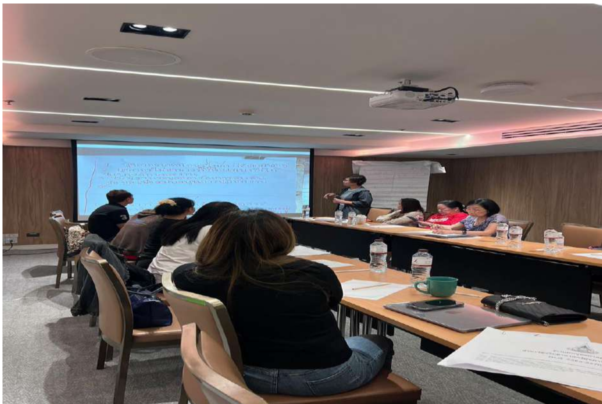
ภาพ 15 - 16 หัวหน้าหน่วยเลขานุการกิจนำเสนอแผนยุทธศาสตร์ และแผนปฏิบัติการของสาขาวิชาวิทยาศาสตร์สุขภาพ และแผนทักษะด้านดิจิทัลของหน่วยเลขานุการ