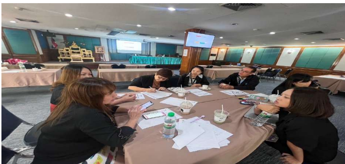
ภาพที่ 3 - 4 เจ้าหน้าที่หน่วยเลขานุการกิจเข้าร่วมประชุมเชิงปฏิบัติการฯ