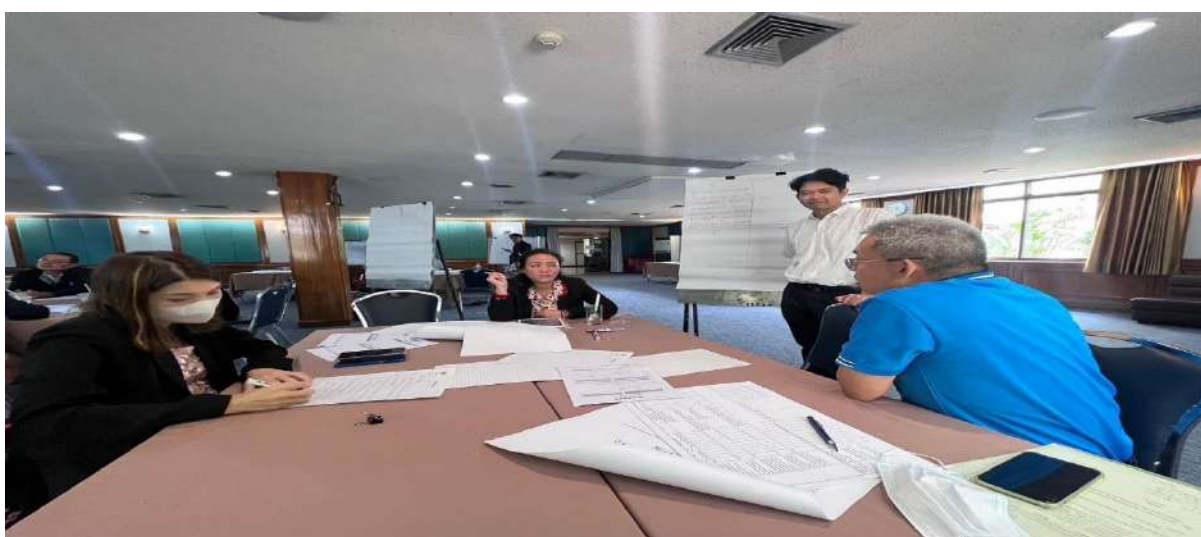
ภาพที่ 5 - 7 เจ้าหน้าที่หน่วยเลขานุการกิจและคณาจารย์เข้าร่วมประชุมเชิงปฏิบัติการฯ เวลา 16.00 สรุปกิจกรรม ที่ได้ดำเนินการจัดทำในวันนี้ จะนำไปต่อยอดในกิจกรรมที่ 2 ณ จังหวัดชลบุรี เวลา 16.30 น.พิธีปิดกิจกรรม