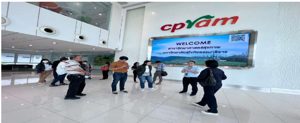
ภาพ 9 บรรยายภาคทั่วไปในการเข้าเยี่ยมชม

ทั้งนี้ การเข้าศึกษาดูงานในส่วนของกระบวนการผลิตต่างๆ ของทางบริษัท ซีพีแรม จำกัด ไม่นับญาติให้บันทึกภาพนิ่งและภาพเคลื่อนไหว และระหว่างการเยี่ยมชมเข้าการผลิตได้มีสอบถามและแลกเปลี่ยนเรียนรู้ในประเด็นต่างๆ กับทางผู้จัดการและเจ้าหน้าที่ของทางบริษัท