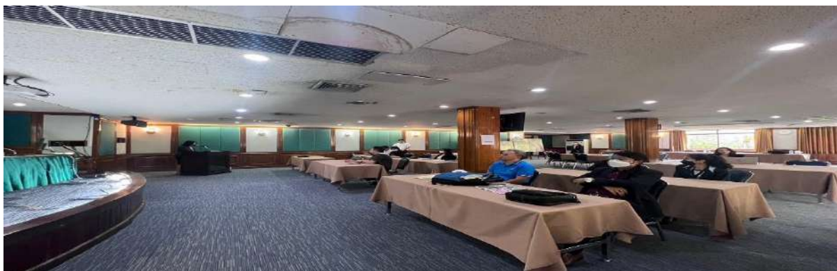
ภาพที่ 1 ประธานกรรมการประจำสาขาวิชาวิทยาศาสตร์สุขภาพ กล่าวเปิดประชุมฯ

เวลา 09.00 - 16.30 น. พิธีเปิดกิจกรรม และประชุมเชิงปฏิบัติการเพื่อแลกเปลี่ยนเรียนรู้ทบทวน ปรับปรุง และจัดทำกิจกรรมแผนยุทธศาสตร์และแผนปฏิบัติการของสาขาวิชาวิทยาศาสตร์สุขภาพ ร่วมกับผู้บริหาร สาขา คณาจารย์สาขาวิชา