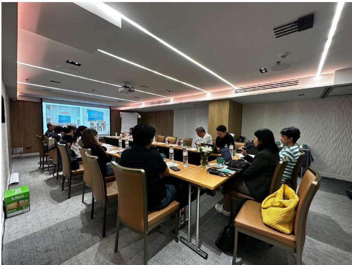
ภาพ 18 ประธานกรรมการประจำสาขาวิชาวิทยาศาสตร์สุขภาพกล่าวสรุปแผนยุทธศาสตร์ แผนปฏิบัติการของสาขาวิชาวิทยาศาสตร์สุขภาพ และแผนทักษะด้านดิจิทัลของหน่วยเลขานุการและปิดประชุม

และผลสรุปโครงการประชุมเชิงปฏิบัติการจัดทำแผนและโครงการส่งเสริมสมรรถนะและทักษะด้านดิจิทัลของหน่วยเลขานุการกิจ สาขาวิชาวิทยาศาสตร์สุขภาพ ประจำปีการศึกษา 2566-2570 และศึกษาดูงานเพื่อพัฒนากระบวนการปฏิบัติงาน สาขาวิชาวิทยาศาสตร์สุขภาพ มหาวิทยาลัยสุโขทัยธรรมาธิราช ที่ได้มีดังนี้