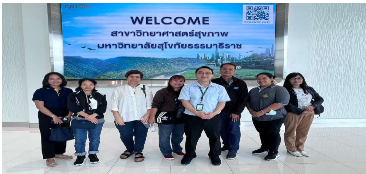
ภาพ 1 เจ้าหน้าที่หน่วยเลขานุการกิจ สาขาวิชาวิทยาศาสตร์สุขภาพ มสธ.