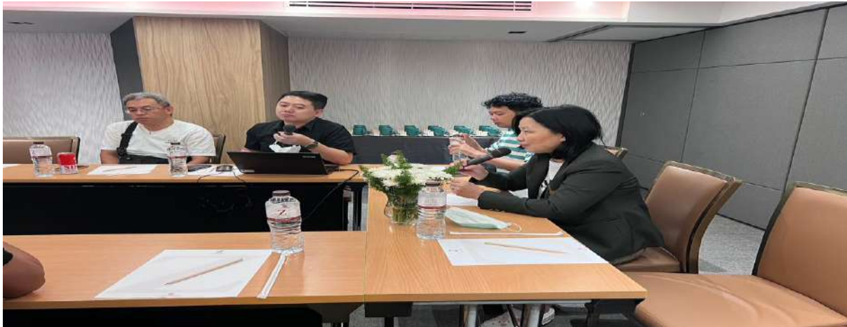
ภาพ 11 ประธานกรรมการประจำสาขาวิชาวิทยาศาสตร์สุขภาพกล่าวเปิดประชุมฯ