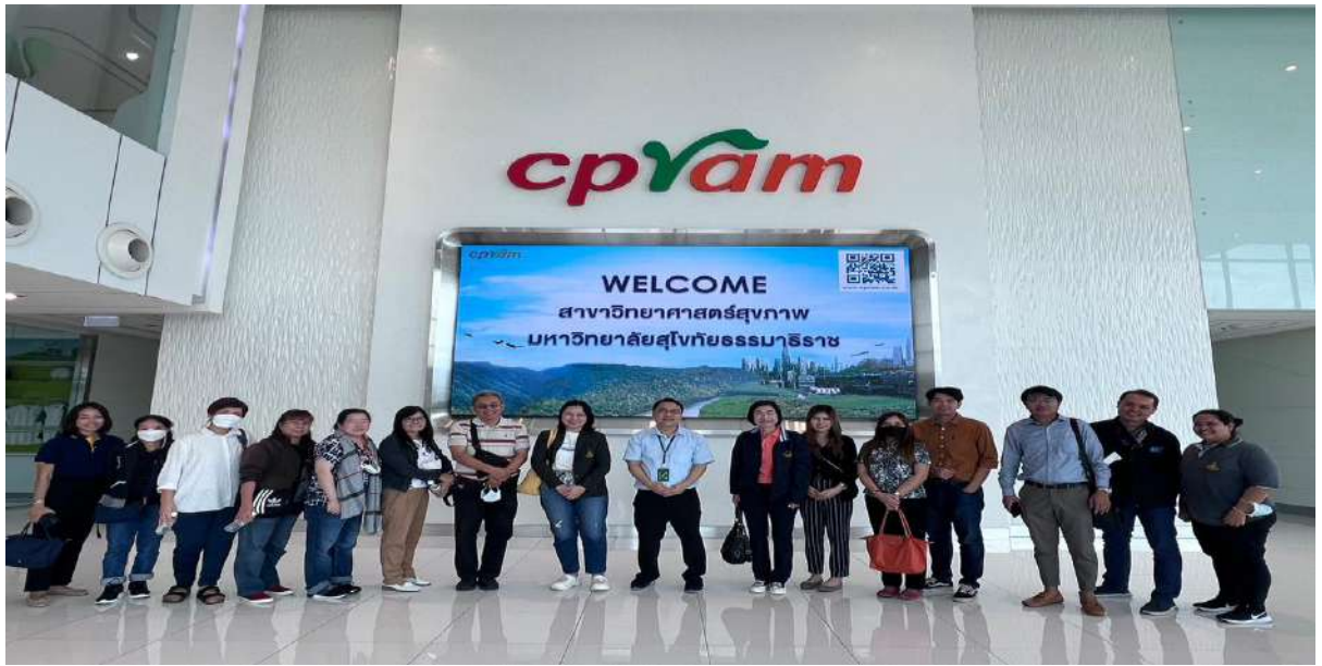
ภาพ 2 คณาจารย์และเจ้าหน้าที่หน่วยเลขานุการกิจ สาขาวิชาวิทยาศาสตร์สุขภาพ มสธ. และผู้จัดการบริษัท ซีพีแรม จำกัด