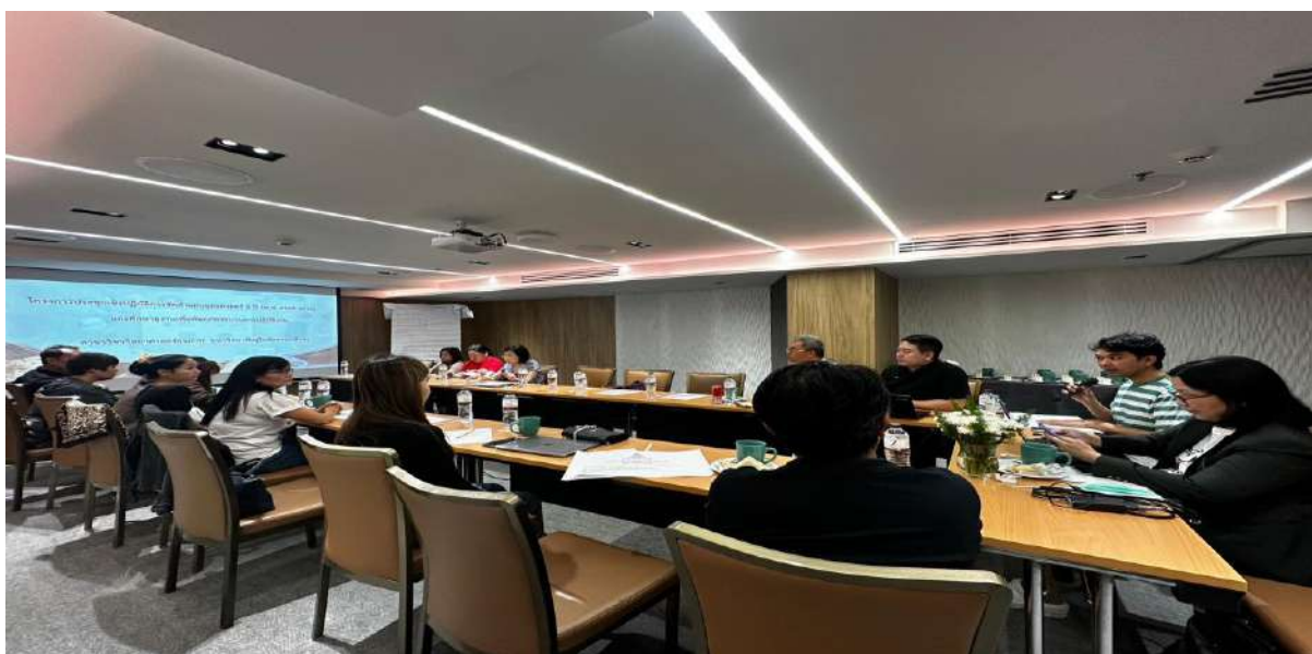
ภาพ 17 เลขานุการสาขาวิชาสรุปแผนยุทธศาสตร์ แผนปฏิบัติการของสาขาวิชาวิทยาศาสตร์สุขภาพ และแผนทักษะด้านดิจิทัลของหน่วยเลขานุการ