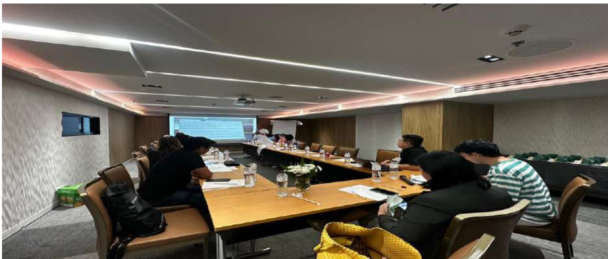
ภาพ 12 ประชุมเชิงปฏิบัติการเพื่อปรับปรุงแผนยุทธศาสตร์และแผนปฏิบัติการของสาขาวิชาวิทยาศาสตร์สุขภาพและทักษะด้านดิจิทัลของหน่วยเลขานุการกิจ สาขาวิชาวิทยาศาสตร์สุขภาพ

เวลา 13.00 - 15.00 น. นำเสนอแผนและสรุปกิจกรรม